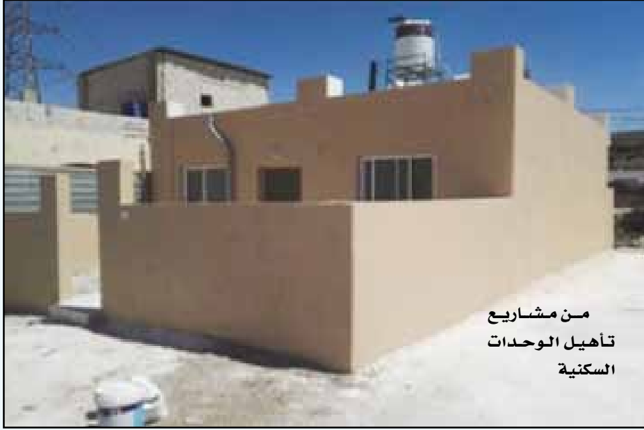
من مشاريع تأهيل الوحدات السكنية

يولي جلالة الملك عبدالله الثاني كل الاهتمام والرعاية لكافة ابناء هذا البلد الطاهر وتلمس احتياجاتهم ومتطلباتهم الاساسية، وقد كان للمخيمات حيز مهم من هذا الاهتمام والرعاية الملكية السامية، حيث كان الاهتمام والرعاية الملكية لابناء المخيمات من خلال المبادرات والمكرم الملكية التي شملت كافة مخيمات اللاجئين في المملكة، نذكر منها ما يخص ابنائه الطلبة في الجامعات الرسمية بتخصيص (٣٥٠) مقعد ومنها ما يخص فقراء المخيمات من خلال توزيع طرود الخير ومنها ما تخصص قطاع الشباب بإنشاء ملاعب وغير ذلك ومنها ما يخص مجتمع المخيم من خلال انشاء مراكز تنموية شاملة وهناك الكثير والتي كان لها الاثر الكبير والمباشر في رفع مستوى معيشة ابناء المخيمات