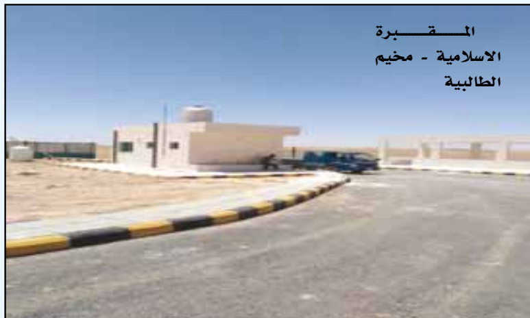
المقبرة الاسلامية - مخيم الطالبة

وتأتي أهمية هذا المركز في كونه صرح هام يساهم في انتاج مشاريع لتمكين المرأة حيث يعمل المركز على تدريب سيدات المخيم في مجالات الخياطة والتجميل مما يتيح لهن المساهمة في رفع مستوى معيشة اسرهن والمستوى الاقتصادي لعائلاتهن، كما يعمل المركز على رفع مستوى التعليم لطلاب المخيم حيث