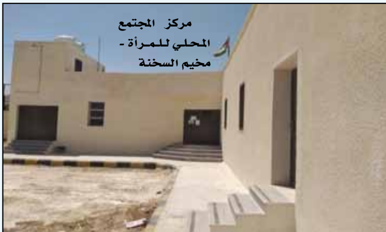
مركز المجتمع المحلي للمرأة - مخيم السخنة

ويهدف المشروع الى إعادة تأهيل مساكن الفقراء، وتشمل إعادة تأهيل جزء من الوحدة السكنية: غرفة، وحمام ومطبخ، بمساحة ٢٣٠،