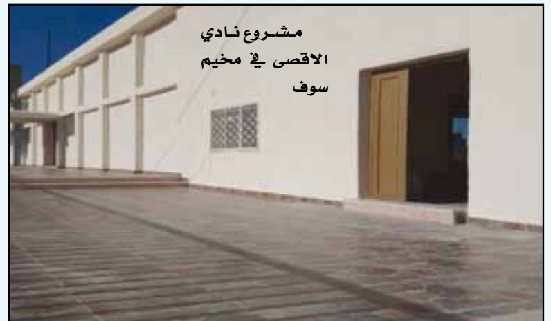
مشروع نادي الاقصى في مخيم سوف