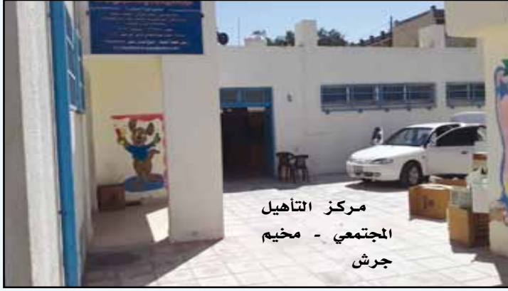
مركز التأهيل المجتمعي - مخيم جرش