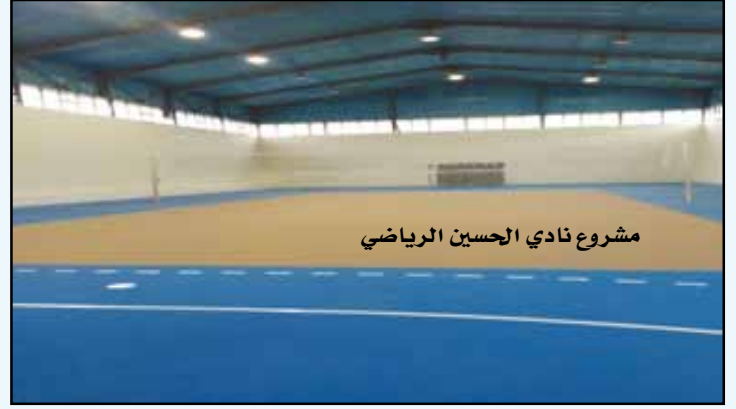
مشروع نادي الحسين الرياضي

بالإضافة الى مشروع مركز تأهيل ذوي الاحتياجات الخاصة في مخيم الأمير حسن بكلفة ١٢ ألف دينار