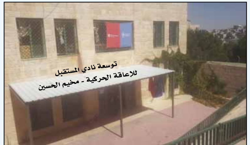
توسعة نادي المستقبل للإعاقة الحركية - مخيم الحسين